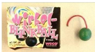
Rauch- und Blitzkugeln