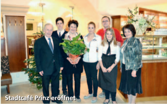
Stadtcafé Prinz eröffnet

HERSTELLUNG: DRUCKHAUS SCHINER, KREMS. UMW 714. GEDRUCKT NACH DEN RICHTLINIEN DES ÖSTERREICHISCHEN UMWELTZEICHENS „SCHADSTOFFARME DRUCKERZEUGNISSE“