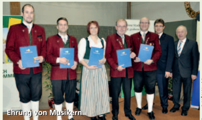
Ehrung von Musikern