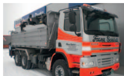
Neu im Schödl-Fuhrpark: ein Kranauto mit modernster Technik