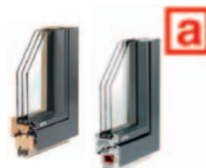
CUBIC und ICON: die flächenbündigen Design-Fenster in Holz-Alu oder Kunststoff(-Alu) von ACTUAL

Firma Seitzl A-3542 Gföhl Langenloiser Straße 4 Telefon +43 (0) 664 / 39 70 144 office@seitzl.at www.aufzu.seitzl.at