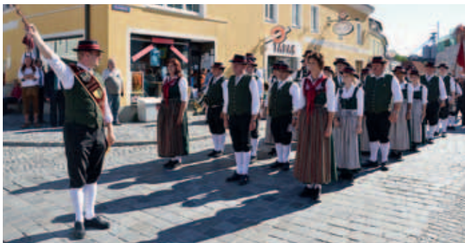
Der Musikverein führte den Festzug zum Festgelände auf dem Bodmershof-Platz hinter dem Rathaus.

Anlässlich des Europäischen Jahres der Freiwilligenarbeit wurde am „Tag der Vereine und Freiwilligen“ den Organisationen besonders gedacht.