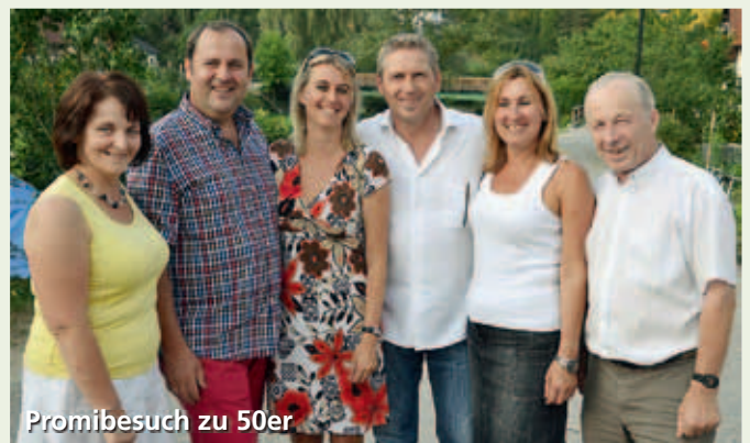
Promibesuch zu 50er