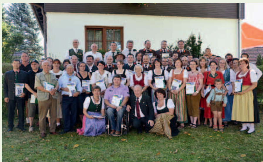
Tag der Vereine und Freiwilligen am 11. September: ein gelungenes Event – gestaltet von den Vereinen und Freiwilligenorganisationen. Die Stadt Gföhl dankte mit einer Urkunde.