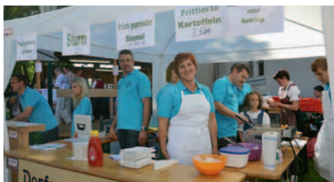
Die Vereine sorgten in bester Stimmung für das leibliche Wohl der Gäste.