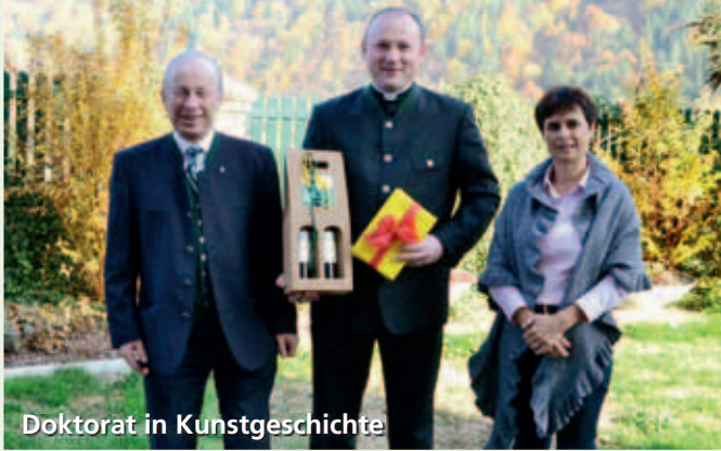
Doktorat in Kunstgeschichte

HERSTELLUNG: DRUCKHAUS SCHINER, KREMS. UMW 714. GEDRUCKT NACH DEN RICHTLINIEN DES ÖSTERREICHISCHEN UMWELTZEICHENS „SCHADSTOFFARME DRUCKERZEUGNISSE“