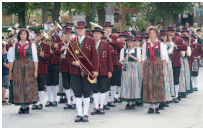
Der Musikverein Gföhl trat bei der Marschmusikbewertung in Schönberg in der Stufe D an und erreichte einen „ausgezeichneten Erfolg“ mit 84,5 Punkten.