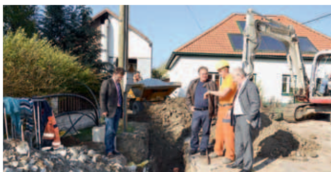
Kontrolle der Errichtung der Straßenbeleuchtung in Reisling.

Der Nachtragsvoranschlag war erforderlich, da unter anderem Mehreinnahmen aus dem Bundesertragsanteilen in der Höhe von rund € 75.000 entstanden sind. Andererseits waren auch außerplanmäßige Ausgaben (Instandhaltungsarbeiten beim Freibad, beim Abwasserkanal und beim Arzthaus, sowie die Anschaffung von neuen Fahrzeugen für den Wirtschaftshof) mit einer Gesamtsumme von € 79.000 erforderlich. Der Gesamtabgang von € 132.000 blieb unverändert, wofür zur Abgangsabdeckung um Bedarfszuweisungsmittel des Landes angesucht wurde. Die Einnahmen und Ausgaben des ordentlichen Haushaltes veränderten sich von € 5.460.400 auf € 5.737.300. Im außerordentlichen Haushalt hat sich der Nachtragsvoranschlag durch Verzögerung von Kanalbauvorhaben in Gföhl und Neubau von € 1.270.700 auf € 745.900 reduziert. Die Beschlussfassung über diesen 1. Nachtragsvoranschlag erfolgte nur mit den Stimmen der ÖVP und FPÖ.