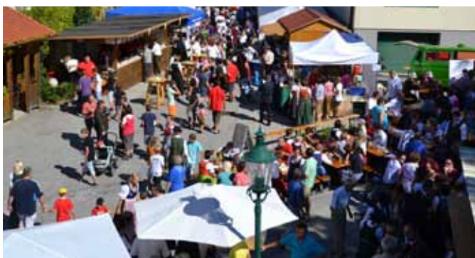
Hunderte Besucher genossen den „Tag der Vereine und Freiwilligen“ bei strahlendem Wetter.

Netzwerk und bringen Abwechslung in die Gemeinde. Für das leibliche Wohl und für das Kinderprogramm wurde seitens der Vereine bestens gesorgt. Der Musikverein Gföhl umrahmte die stimmungsvolle Veranstaltung. Im Stadtsaal wurde der neue Imagefilm „Stadt Gföhl und Katastralgemeinden“ präsentiert. Die zahlreichen Besucher zeigten sich vom Angebot begeistert.